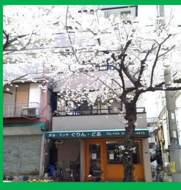
【灘店を外から見た写真】

平成25年2月14日、ついに念願の新店舗「ぐりん・どあ灘店」がオープンしました。地域で受け入れられるか心配しておりましたが、オープン当初からリピーターのお客様がいただき、現在のところ売り上げを順調に伸ばしています。灘店では弁当の店頭販売を中心としていますが、サイドメニューとして販売しているいなり寿司が好評を博しています。また店内にはイートインコーナーも設けています。今のところ、日替わり弁当を500円で販売しているほか、お子様向けとして子供用弁当を300円で販売しています。